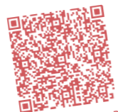
GiroCode Zweck B

2025 sind 150 Konfis und 35 Teamer zur „Stader Flotte“ aufs IJsselmeer gefahren. 76.596,26 € hat diese Segelfreizeit gekostet, die wir u.a. mit 17.886,50 € an Spenden für den „Zweck B“ finanzieren konnten. Mit Ihrer Spende helfen Sie, dass die Flotte auch 2026 finanziell abgesichert ist.