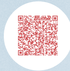
GiroCode Zweck A

35 Jahre nach großartiger Restaurierung der Erasmus Bielfeldt-Orgel von 1736 steht die Reinigung des Instruments an: Alle Pfeifen werden in die Hand genommen, hier und da wird nachintoniert, und am Ende wird die Orgel grundlegend gestimmt. Die umfangreichen Arbeiten unter Leitung von Hendrik Ahrend werden ca. 50.000 € kosten.